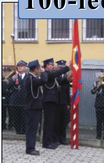
Wciągnięcie flagi związkowej