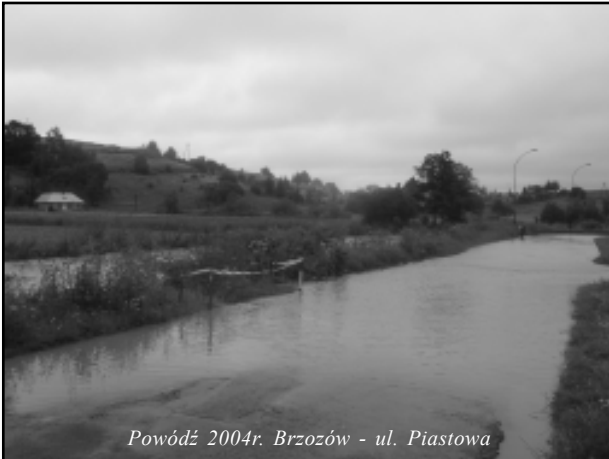
Powódź 2004r. Brzozów - ul. Piastowa

Po powodzi, jaka pod koniec lipca br. wystąpiła na terenie powiatu brzozowskiego, w sierpniu br. zaszła konieczność wykonania powtórnych remontów cząstkowych nawierzchni dróg smołowych masą asfaltową. Na drogach o słabej nawierzchni powstały nowe wyboje, w związku z czym wyremontowano 11 odcinków dróg, na co nałożono 60 ton masy asfaltowej na garąco.