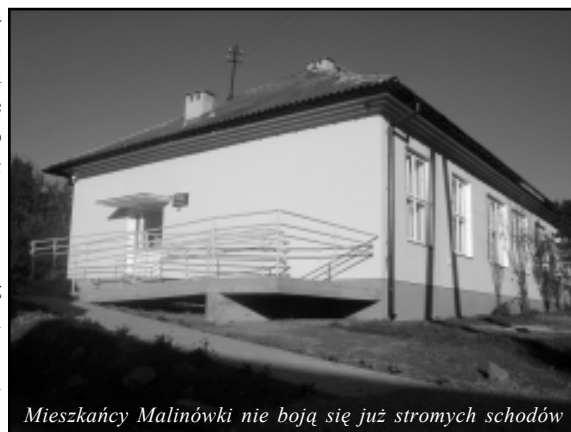
Mieszkańcy Malinówki nie boją się już stromych schodów