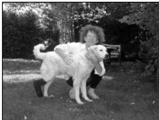
Przekazę Łajtka w dobre ręce ...