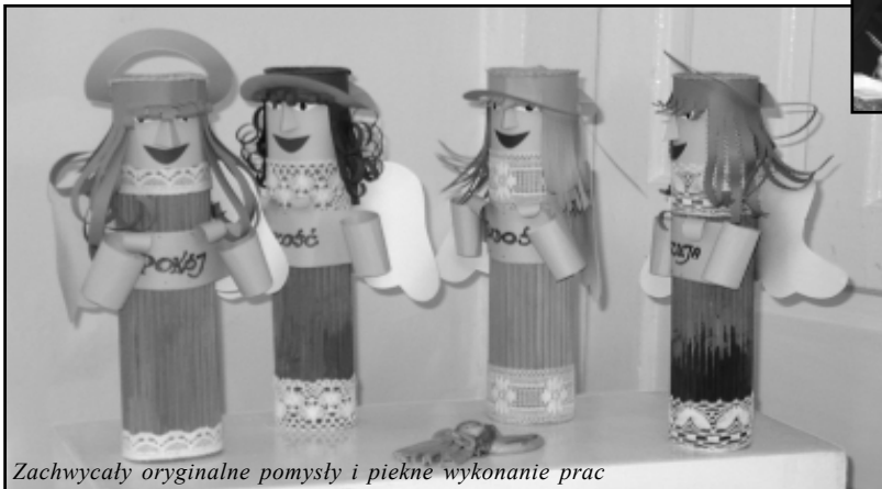
Zachwycały oryginalne pomysły i piękne wykonanie prac