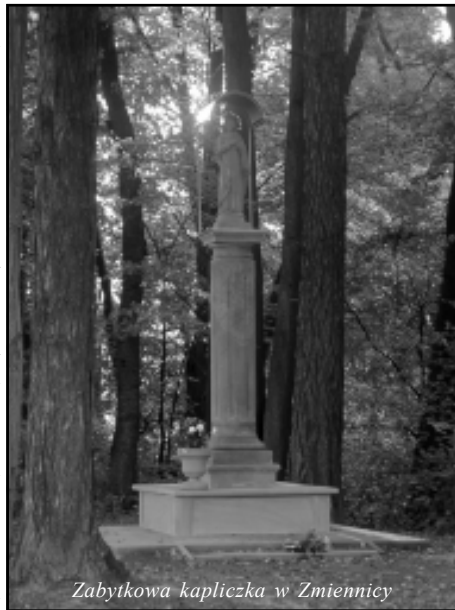
Zabytkowa kapliczka w Zmiennicy

zresztą jak 17 innych, które w 1850 w zbiorze „Wianeczek majowy” wydał jezuita Karol Antoniewicz (1807-1852). Życie tego człowieka było bardzo dramatyczne, ale i pełne pracy. Urodził się we Lwowie, w rodzinie ormiańskiej. Ukończył studia prawnicze, wziął udział w powstaniu listopadowym. Żonaty, miał piątkę dzieci, które zmarły w młodym wieku. Nie stracił wtedy wiary, zajął się chorymi i opuszczonymi, a swój majątek zamienił na szkołę i szpital. Po śmierci żony w roku 1839 wstąpił do jezuitów w Starej Wsi, gdzie cztery lata później złożył śluby zakonne. Później stał się znanym kaznodzieją, zwalczającym pijaństwo i prowadzącym wiele akcji charytatywnych i pomocowych. Przyczynił się też do uspokojenia nastrojów