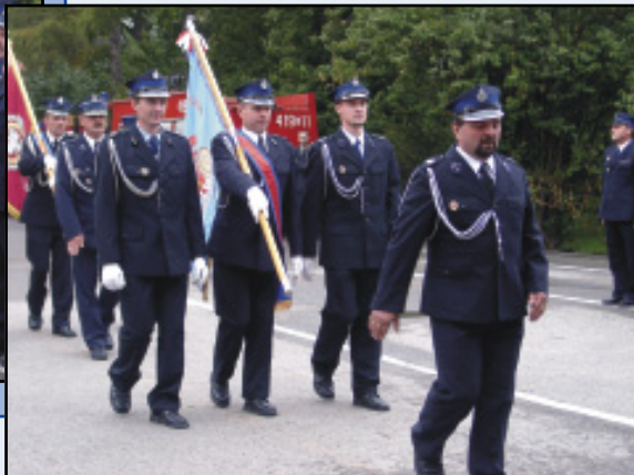
Wystąpienie do odnaczenia ...