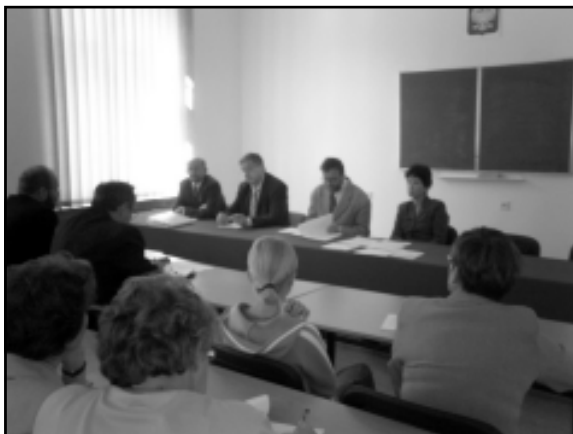
Forum prasy samorządowej w Sanoku

Z kolei w stosunku do gazet parafialnych coraz mocniej wyczuwalny jest zwrot „od formacji do informacji”. Oznacza to, że prasa ta powoli odchodzi od głoszenia wyłącznie ogólnych prawd doktrynalnych, a coraz więcej miejsca poświęca specyfice życia parafialnego. – Obecnie jeszcze bardzo często wystarczy zmienić tytuł czy wezwanie kościoła, a gazetka taka mogłaby obsłużyć większość parafii w Polsce – zauważył red. Gancarz.