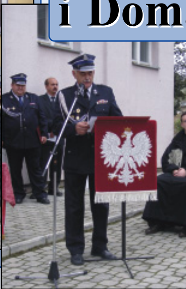
Prezes OSP Domaradz przedstawia historię jednostki