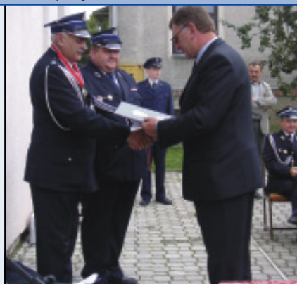
Wręczenie listów gratulacyjnych

„Brzozowska Gazeta Powiatowa”- miesięcznik samorządu powiatowego.