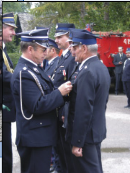
Odnaczenia dla najbardziej zasłużonych