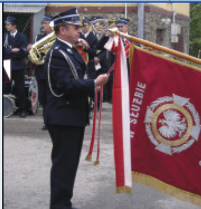
... flag związkowych