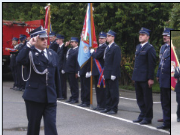
Prezes ZW ZOSP RP w Rzeszowie wita jednostki OSP